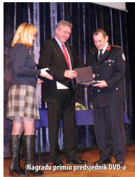
Nagradu primio predsjednik DVD-a

Kako se navodi u obrazloženju nagrade, DVD San Marino jedna je od najaktivnijih i najvažnijih udruga u Novom Vinodolskom koja okuplja više od 140 članova. Operativna postrojba Društva samostalno obavlja vatrogasnu djelatnost na području Grada, a nerijetko pri intervencijama pomaže vatrogasnim postrojbama iz širega okruženja. U posljednjih 10 godina novljanski su vatrogasci u prosjeku imali 130 intervencija na godinu, a većinu su ih samostalno odradili.