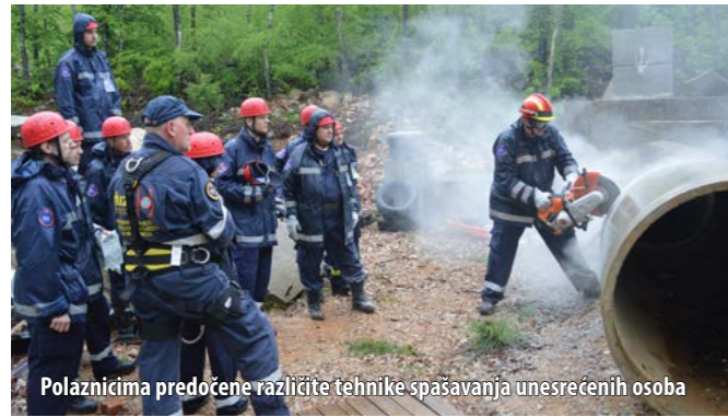
Polaznicima predložene različite tehnike spašavanja unesrećenih osoba