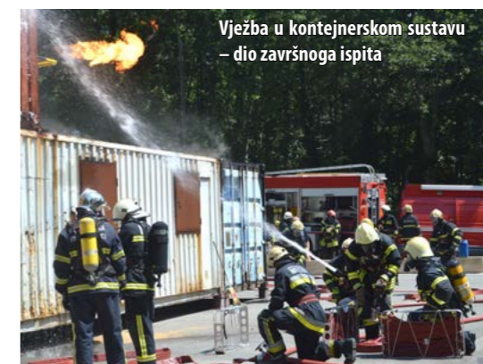
Vježba u kontejnerskom sustavu – dio završnoga ispita

Kao i prošlogodišnji polaznici, i ovogodišnji su morali svladati poprilično zahtjevno gradivo, raspoređeno u 13 predmeta i 819 školskih sati. Nastavne sadržaje predavali su im predavači iz redova VZPGŽ-a, redom istaknuti vatrogasni stručnjaci i profesori.