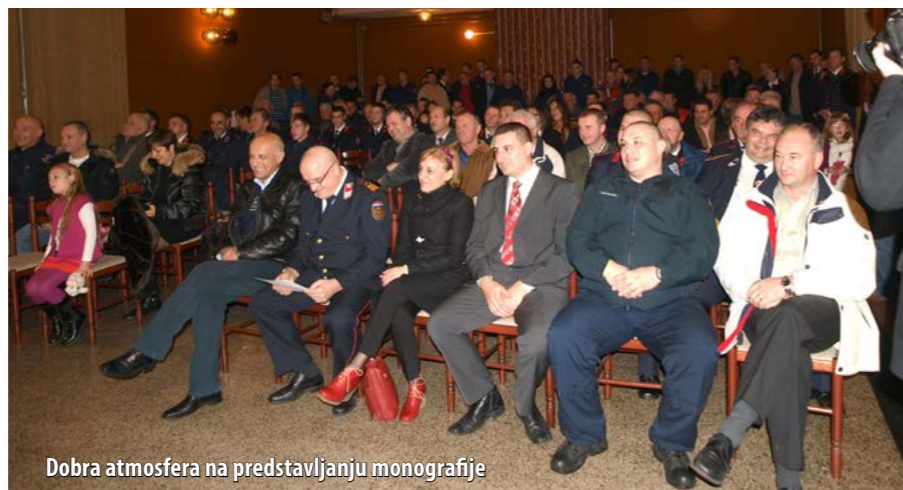
Dobra atmosfera na predstavljanju monografije