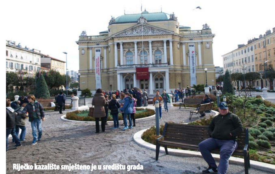
Riječko kazalište smješteno je u središtu grada

Kazališna je zgrada izgrađena u najužem gradskom središtu. Sa sjevera i istoka nalaze se široke gradske prometnice, a s juga i zapada šetnica, odnosno park. Prilaz zgradi u slučaju vatrogasne intervencije vrlo je lak, a tek kilometar-dva dalje sjedište je i Javne vatrogasne postrojbe Grada Rijeke. Riječki HNK spada u II. B skupinu prema kategorizaciji javnih objekata, što znači da može primiti od 500 do 1000 ljudi. HNK ima 300-tinjak zaposlenika, a kapacitet gledališta je nešto manje od 700 ljudi.