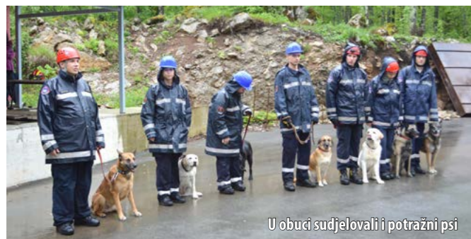
U obuci sudjelovali i potražni psi

Područni ured za zaštitu i spašavanje ostvaruje sa županijskom Vatrogasnom zajednicom koja je, eto, rezultirala i našim dolaskom u Šapjane. Ovo je idealno mjesto za treniranje naših postrojbi pa se nadamo da ćemo i dalje surađivati. Zahvaljujem i instruktorima JVP-a Rijeka koji su obučavali naše pripadnike, rekao je Škalamera, istodobno pohvalivši pripadnike CZ-a koji su, unatoč lošem i kišovitom vremenu, uspješno odradili sve planirane vježbe.