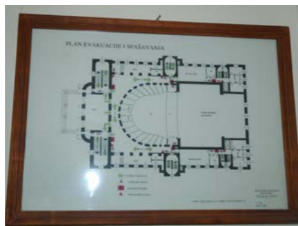
Planovi evakuacije izvedeni su po cijeloj zgradi

Sustav vatrozaštite u riječkome HNK, čini se, „najtanji“ je u segmentu edukacije ljudi. Sukladno zakonu, svi zaposlenici prošli su jednokratnu obuku o zaštiti na radu i protupožarnoj zaštiti, bilo pod okriljem HNK ili ranijih poslodavaca. No, tu njihova protupožarna edukacija završava jer Kazalište nema dodatnih edukativnih programa za zaposlene. Pro-