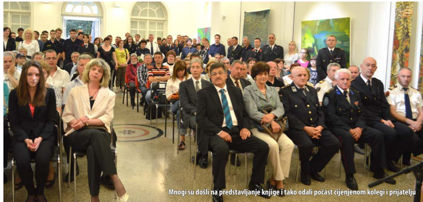
Mnogi su došli na predstavljanje knjige i tako odali počast cijenjenom kolegi i prijatelju