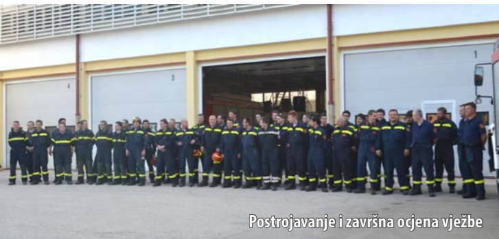
Postrojavanje i završna ocjena vježbe

U vježbi su ukupno sudjelovala 42 vatrogasca i 10 vozila. Te su vatrogasne snage „napale“ požar postavljanjem „C“ tlačnih pruga, kao i pojedinačnim gašenjem uz pomoć naprtnjača čime je spriječeno širenje požara. Istodobno, postavljen je relejni sustav kojim je morska voda prebačena u rezervoar – gumeni spremnik, a potom je „D“ tlačnom pumpom s 1 „D“ mlazom uz pomoć plutajuće pumpe ta voda iskorištena za gašenje istočnoga ruba požara. Pri gašenju požara korištene su i tlačne pruge s vozila.