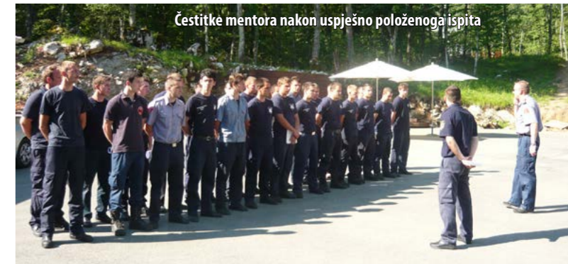
Čestitke mentora nakon uspješno položenoga ispita

S redinom lipnja u obučnome centru u Šapjanama održan je završni ispit za polaznike druge generacije Vatrogasne škole HVZ-a. Od 47 polaznika iz cijele Hrvatske, uvjete za polaganje završnoga ispita steklo je njih 27, kao i dva polaznika iz prve generacije. Pored usmenoga ispita, polaznici su morali pokazati i praktična znanja te ih primijeniti na vježbi izvedenoj u kontejnerskome sustavu za gašenje požara zatvorenoga prostora (provjera korištenja zaštitne opreme i tehničkih alata, postupak gašenja požara, prepoznavanje i rješavanje opasnih situacija). Ispit su uspješno položili svi kandidati, a ostali, koji nisu pristupili prvom ispitnom roku, imat će još dvije šanse – u srpnju i rujnu.