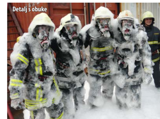
Detalj s obuke