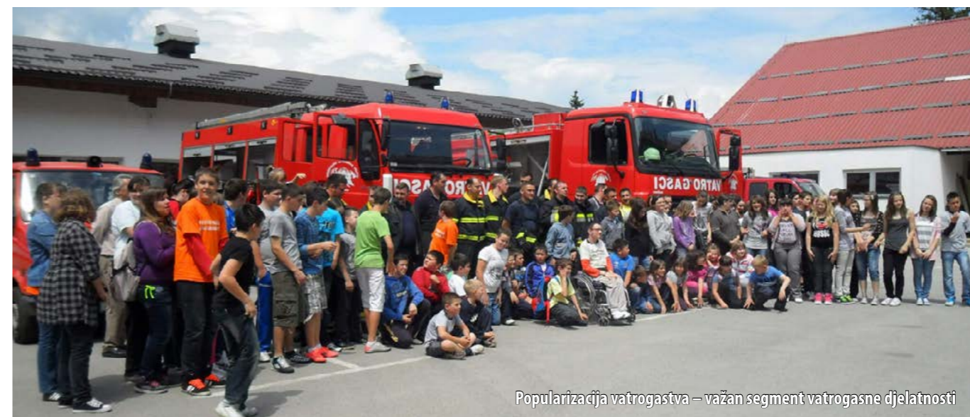
Popularizacija vatrogastva – važan segment vatrogasne djelatnosti