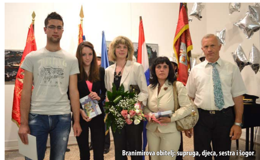
Branimirova obitelj: supruga, djeca, sestra i šogor

Liburnijski su vatrogasci i ove godine nizom događanja tradicionalno obilježili svoj blagdan, Dan sv. Florijana, zaštitnika vatrogasaca. Glavno zbivanje priređeno je 4. svibnja u Paviljonu Juraj Šporer u Opatiji, gdje je predstavljena knjiga poezije Branimira Alfonzija, opatijskoga vatrogasca stradaloga tijekom intervencije prošloga ljeta.