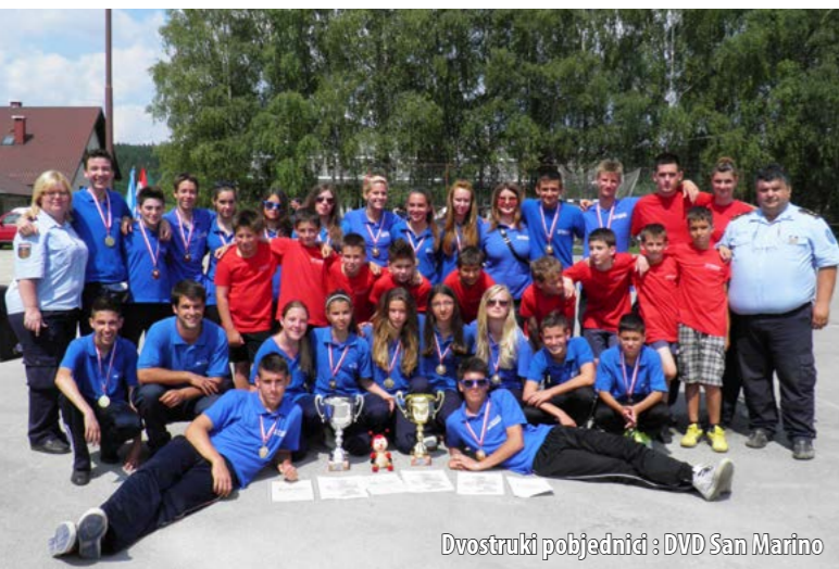
Dvostruki pobjednici: DVD San Marino