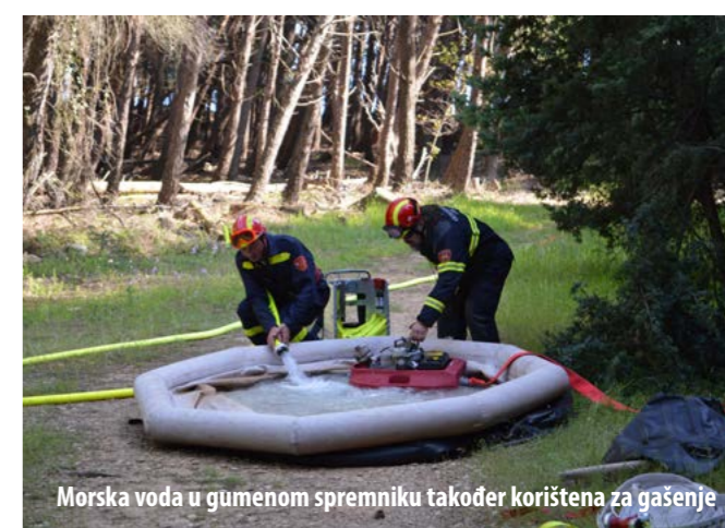
Morska voda u gumenom spremniku također korištena za gašenje