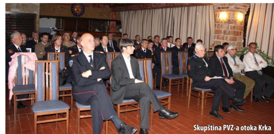
Skupština PVZ-a otoka Krka