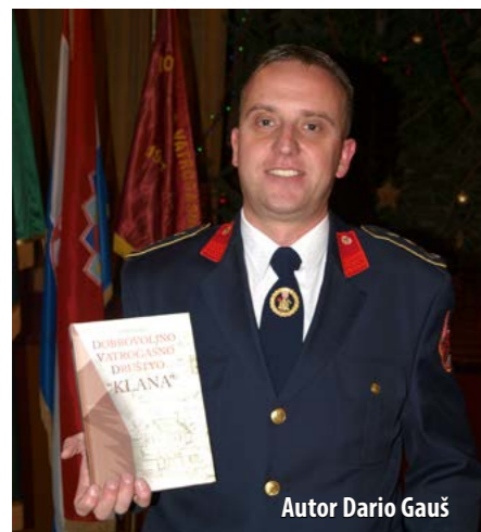
Autor Dario Gauš