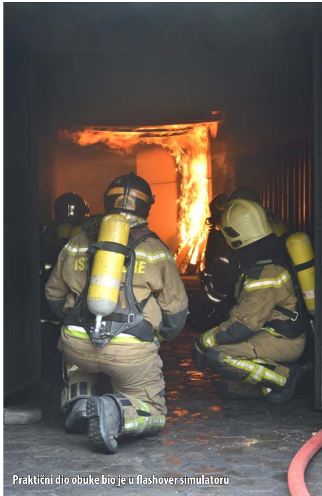
Praktični dio obuke bio je u flashover simulatoru