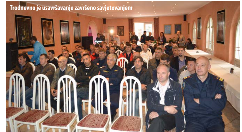
Trodnevno je usavršavanje završeno savjetovanjem

Uobičajeno je da radionice tog tipa završe savjetovanjem namijenjenim širem auditoriju, pa je tako bilo i u Rupi gdje je održano savjetovanje o sigurnosti i zaštiti zdravlja vatrogasaca pri obavljanju svakodnevnih zadaća, osobito zaštiti dišnih organa i kože. Predavači iz Australije, Belgije i Hrvatske predstavili su najbolju praksu obuke i treninga vatrogasaca čiji