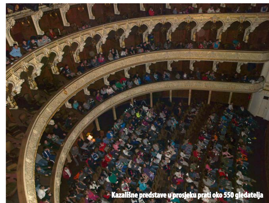
Kazališne predstave u prosjeku prati oko 550 gledatelja