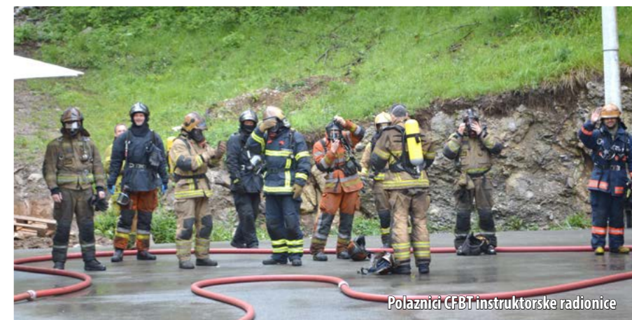
Polaznici CFBT instruktorske radionice