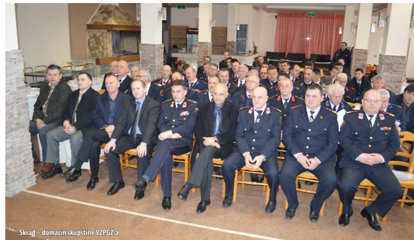
Skrad – domaćin skupštine VZPGŽ-a

Mance je podsjetio i na veliku pozornost koja se pridaje osposobljavanju vatrogasnoga kadra.