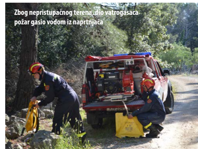
Zbog nepristupačnog terena, dio vatrogasaca požar gasio vodom iz naprtnjaca