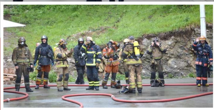
Svečana sjednica HVZ-a u Rijeci