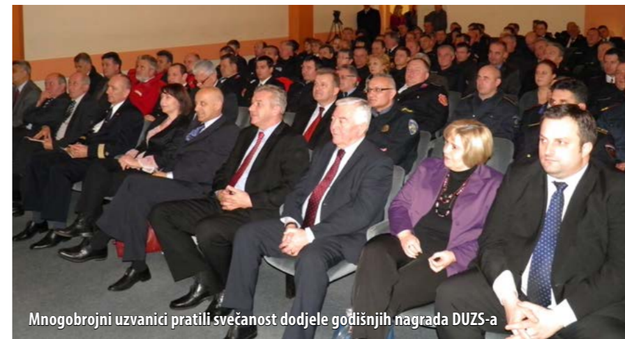
Mnogobrojni uzvanici pratili svečanost dodjele godišnjih nagrada DUZS-a