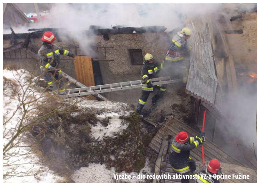
Vježbe – dio redovitih aktivnosti VZ-a Općine Fužine