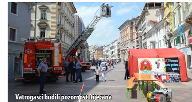
Vatrogasci budili pozornost Riječana

Višednevno je obilježavanje rođendana riječkih vatrogasaca upotpunjeno i izložbom povijesnih vatrogasnih dokumenata i fotografija u Narodnoj čitaonici, pod motom 150 godina poslušnosti u službi građana Rijeke , a nekoliko je dana na Korzu bio