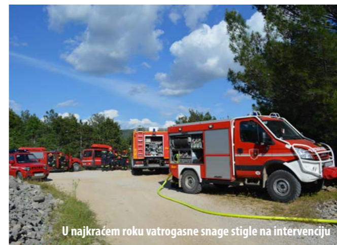
U najkraćem roku vatrogasne snage stigle na intervenciju