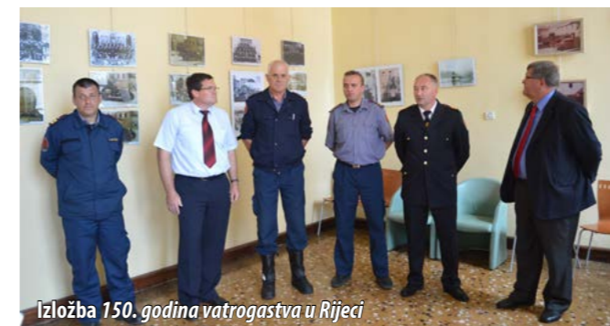
Izložba 150. godina vatrogastva u Rijeci