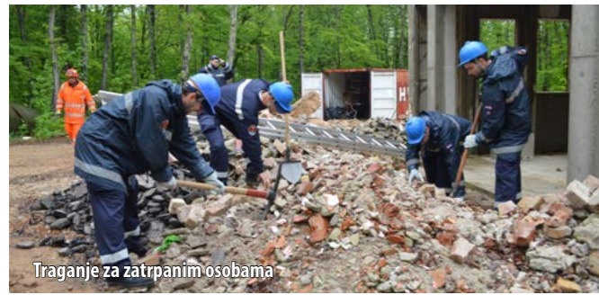
Traganje za zatrpanim osobama