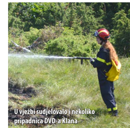
U vježbi sudjelovalo i nekoliko pripadnika DVD-a Klana

Naglim jačanjem vjetrova, dolazi do prebacivanja požara koji se počeo širiti livadom u pravcu sjeveroistoka te zaprijetio objektima u mjestu Lisac. Zapovjednik I sektora traži pomoć od ŽVOC-a Rijeke. U drugom stupnju angažiranja snaga u sektor rada uključuju se: dežurna smjena JVP-a Grada Rijeke i vatrogasna postrojba DVD-a Halubjan (ukupno 8 vatrogasaca). Po dolasku dodatnih snaga iz Rijeke, uspostavlja se relejna dobava vode s navalnog vozila prema terenskom vozilu na rubu požara. Tehnika koju koriste vatrogasne snage temelji se na cijevnim prugama s vozila