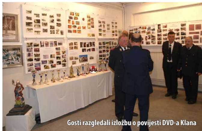
Gosti razgledali izložbu o povijesti DVD-a Klana