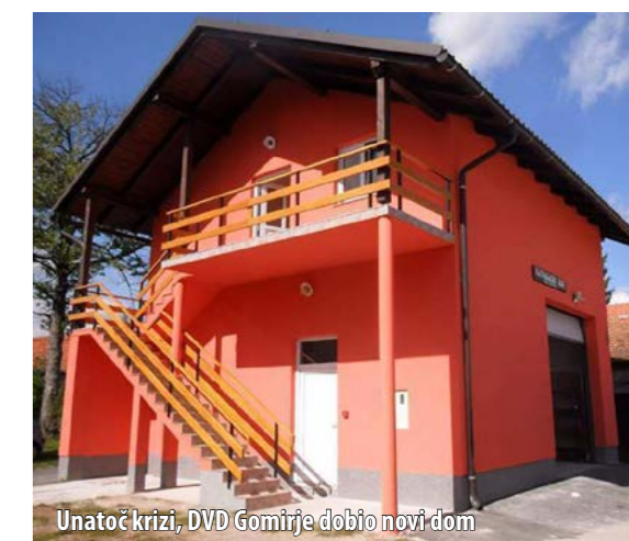
Unatoč krizi, DVD Gomirje dobio novi dom

Istaknuta je i dobra suradnja koju Zajednica ostvaruje sa susjednim vatrogasnim zajednicama te JVP-om Delnice, pogra-