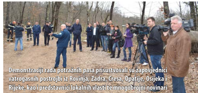
Demonstraciji rada potražnih pasa prisustvovali su zapovjednici vatrogasnih postrojbi iz Rovinja, Zadra, Cresa, Opatije, Osijeka i Rijeke, kao i predstavnici lokalnih vlasti i mnogobrojni novinari

N a inicijativu VZPGŽ-a, sredinom travnja pod okriljem HVZ-a osnovano je Povjerenstvo za licenciranje vatrogasnih potražnih pasa. Time se HVZ, kao krovna organizacija hrvatskoga vatrogastva, i formalno odredio prema vatrogasnim potražnim psima koji su već neko vrijeme punopravni članovi vatrogasnih timova za spašavanje iz ruševina, ponajprije zahvaljujući vatrogascima Primorsko-goranske županije koji su, prvi u Hrvatskoj, u svoje specijalizirane timove uveli i potražne pse.