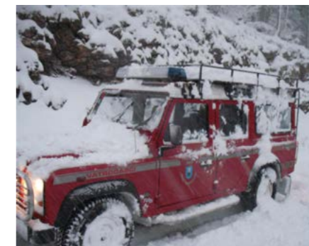
Vatrogasci Novog probijaju se do četvorice mladića koji su jedne prosinačke noći ostali odsječeni na protupožarnoj šumskoj cesti na predjelu Pleteno

Posebno zahtjevan bio je 23. srpnja kada je veliki požar, potpomognut olujnom burom, poharao područje Grada Crikvenice i Općine Vinodolske. Postrojba DVD-a