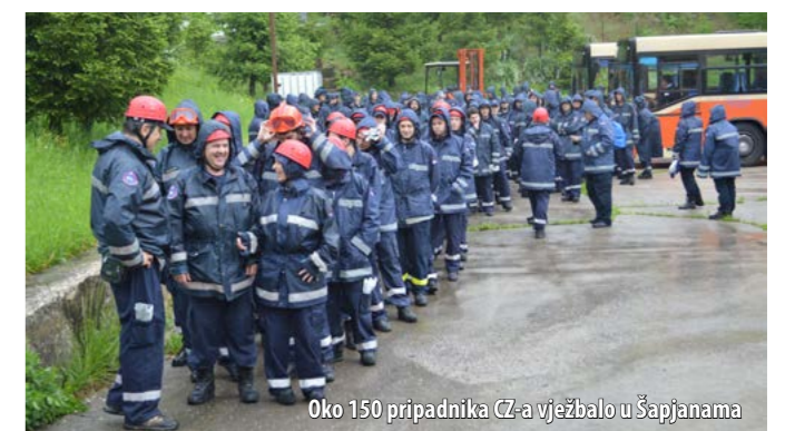
Oko 150 pripadnika CZ-a vježbalo u Šapjanama

Pripadnici CZ-a uvježbavali su različite načine izvlačenja ljudi iz ruševina pri čemu su koristili razne alate i opremu, upoznali su se i s načinom rada potražnih pasa, kao i postupkom formi-