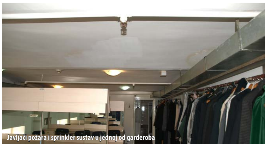
Javljači požara i sprinkler sustav u jednoj od garderoba

tupožarne se vježbe ne održavaju, iako je to zakonska obveza. Također, nije uspostavljena nikakva suradnja s JVP-om Grada Rijeke u smislu zajedničkoga promišljanja o unapređenju vatrozaštite u Kazalištu, iako i sam Mišljenović smatra da takav oblik suradnje ne bi bio loš, bez obzira što to nije zakonska obveza.