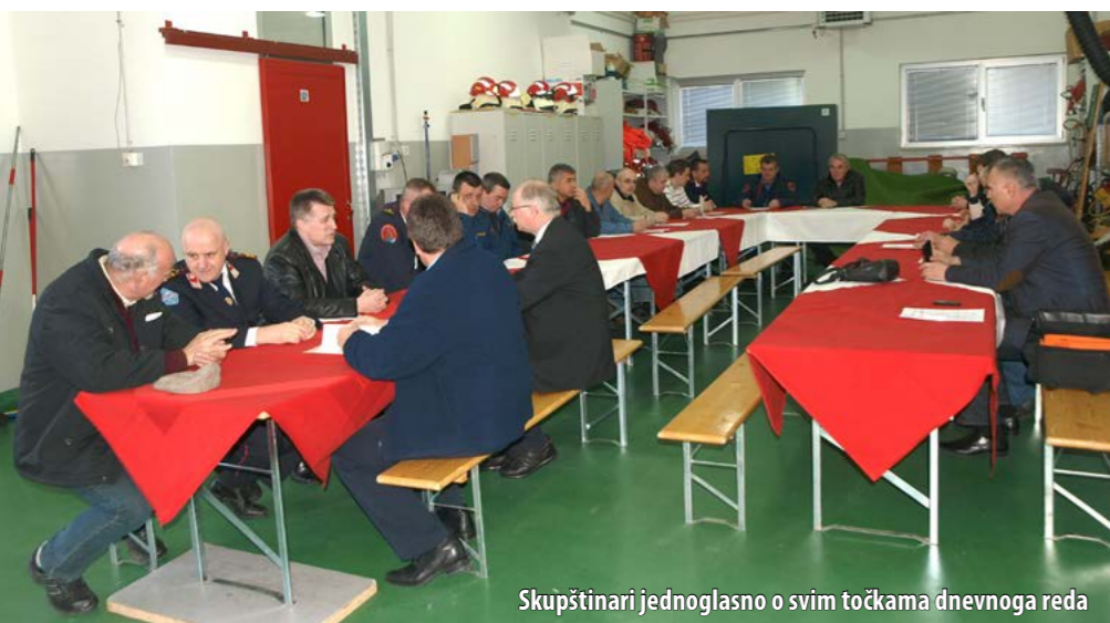
Skupštinari jednoglasno o svim točkama dnevnoga reda

gasna natjecanja na kojima su ostvareni zapaženi rezultati. Rad s mladeži bio je također važan segment djelatnosti, kao i promidžba vatrogastva, u sklopu koje je proveden i tradicionalni natječaj za najbolje učeničke likovne i literarne radove na temu vatrogastva, podsjetio je Mance.