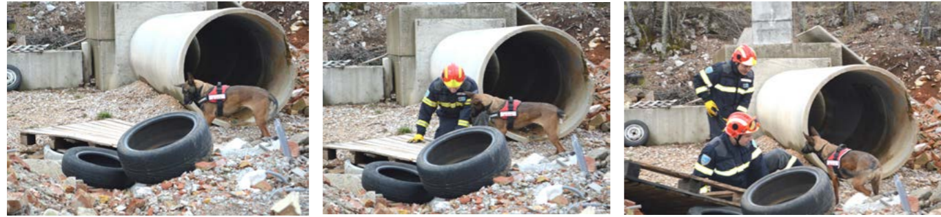
Potražni pas lajanjem upozorava vodiča da je ispod ruševina žrtva, nakon čega slijedi spašavanje

N a inicijativu VZPGŽ-a, sredinom travnja pod okriljem HVZ-a osnovano je Povjerenstvo za licenciranje vatrogasnih potražnih pasa. Time se HVZ, kao krovna organizacija hrvatskoga vatrogastva, i formalno odredio prema vatrogasnim potražnim psima koji su već neko vrijeme punopravni članovi vatrogasnih timova za spašavanje iz ruševina, ponajprije zahvaljujući vatrogascima Primorsko-goranske županije koji su, prvi u Hrvatskoj, u svoje specijalizirane timove uveli i potražne pse.