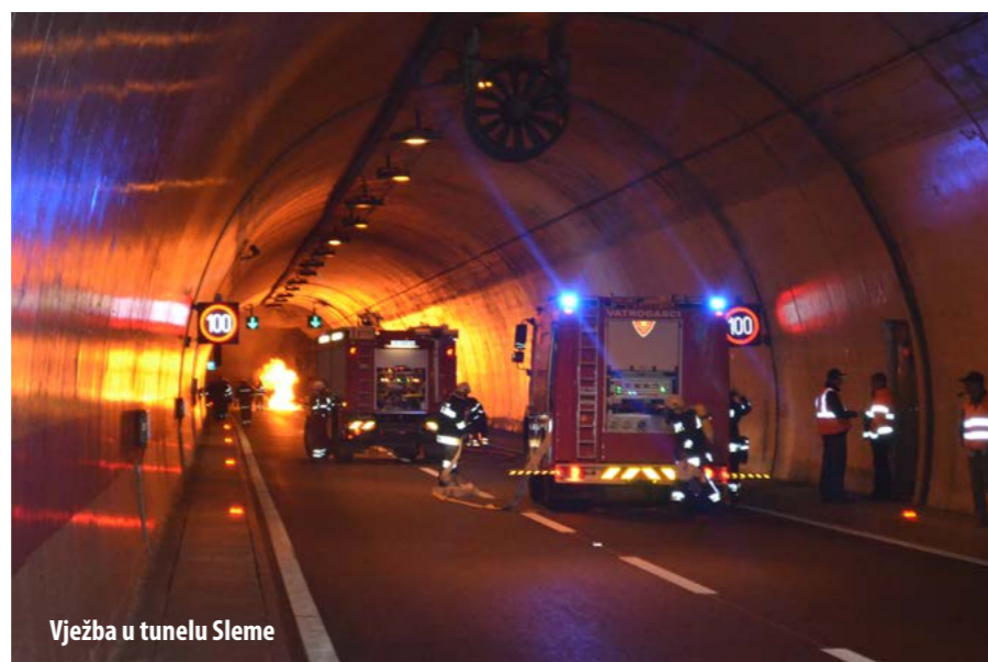
Vježba u tunelu Sleme

Članovi Društava su tijekom godine uložili dosta truda u pripreme i održavanje operativne spremnosti, prvenstveno u održavanje vozila. Unatoč tome, ukupna