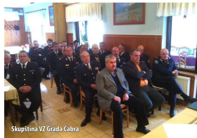
Skupština VZ Grada Čabra