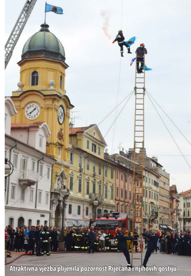
Atraktivna vježba plijenila pozornost Riječana i njihovih gostiju